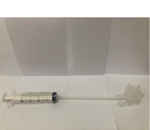
B: Extractor Assembly