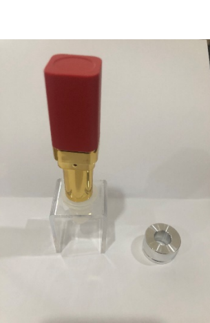
C: Remove Metal Ring and Place Case on Lip Balm