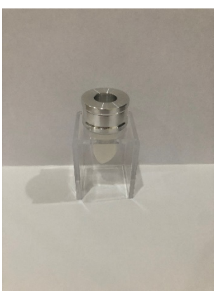
A: Mold Assembly