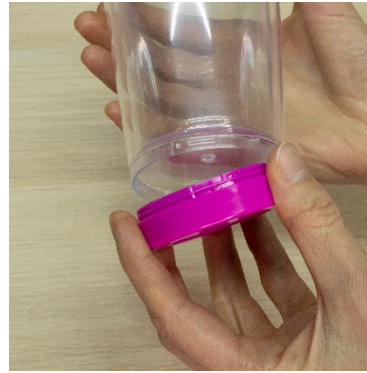
1. Twist to open