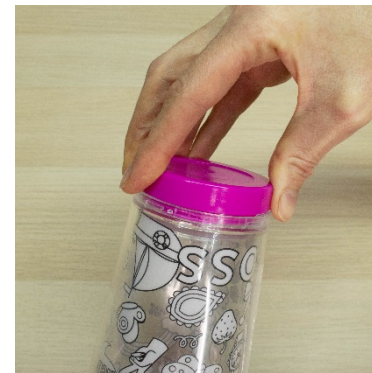
4. Twist to lock base