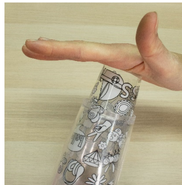
3. Tap in