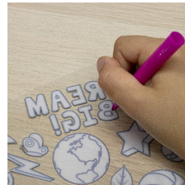
6. Color on backside of sleeve for best results