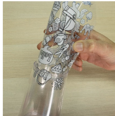
2. Start on an angle